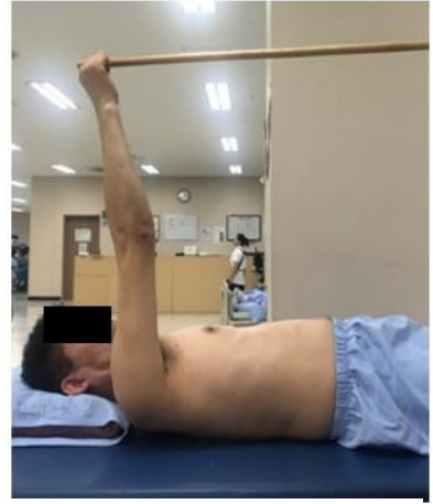
Figure 3. Active movement within self-control range