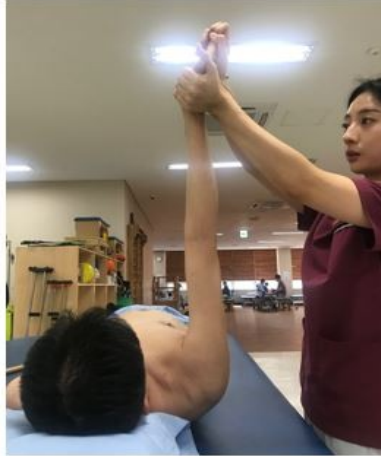
Figure 2. Holding his arm in space with elbow extended