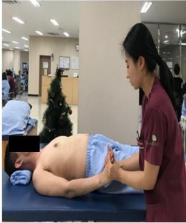
Figure 1. Initiation of forward reaching in supine