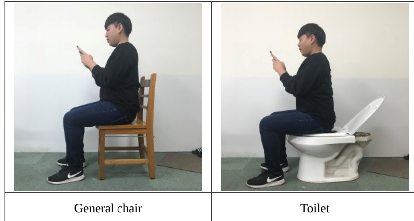
145 Figure 1. Sitting position on a general chair and toilet during using a smartphone 146 General chair and toilet sitting position during using a smartphone