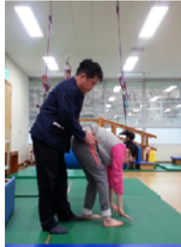
Figure 6. Plantigrade forward walking