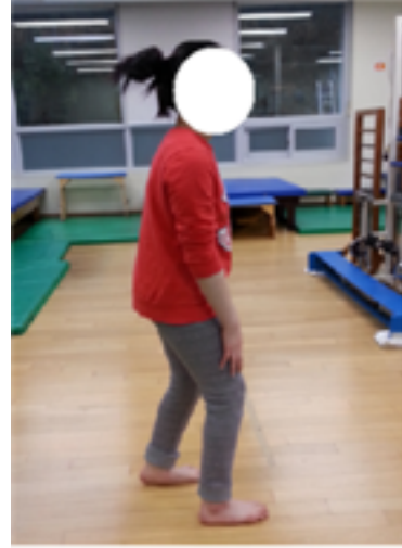
from side to side