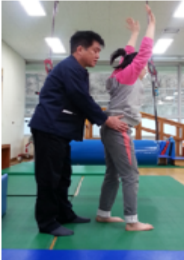
Figure 5. Plantigrade walking