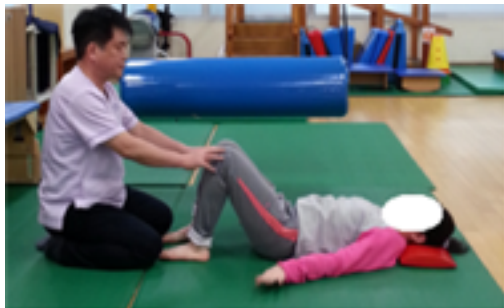
Figure 1. Supine position